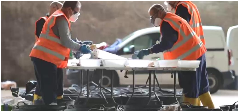
Ilustración 1. Caracterización manual

Las caracterizaciones manuales ofrecen una información necesaria, para poder cumplir los requisitos de información en materia de residuos, pero además extremadamente útil, especialmente para la planificación de la recogida, las actuaciones de sensibilización y, en definitiva, la mejora continua de la separación en origen de las diferentes fracciones.