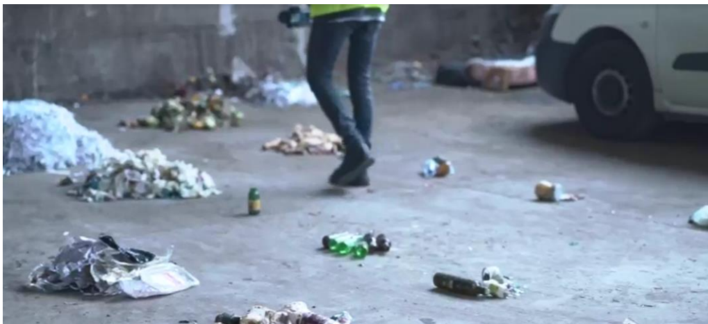
Ilustración 2. Fracciones separadas en una caracterización manual

Esta necesidad de mejora continua tiene que estar soportada por la certeza de que los datos extraídos de las caracterizaciones manuales son significativos y estadísticamente válidos .